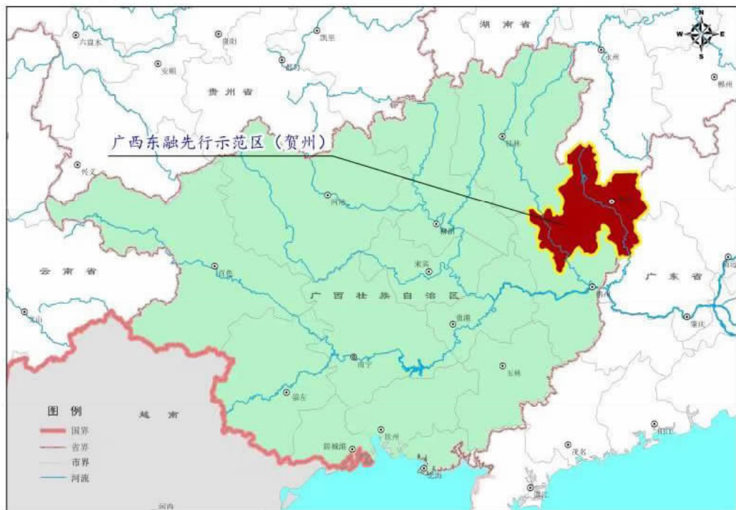
图2 广西东融先行示范区（贺州）在广西的位置